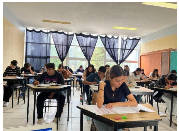
Aplicación del examen de admisión