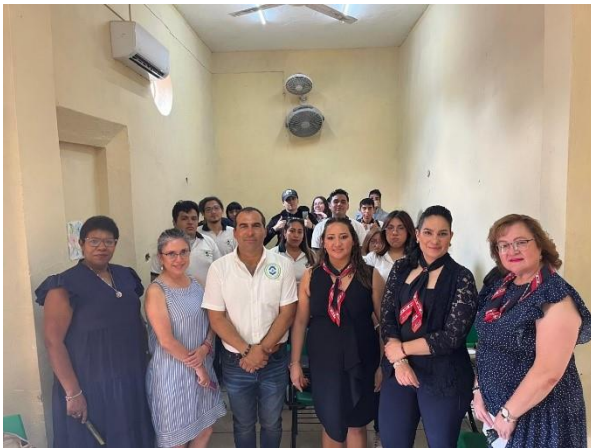
Charlas profesiográficas en la Escuela de Bachilleres Constitución de 1917