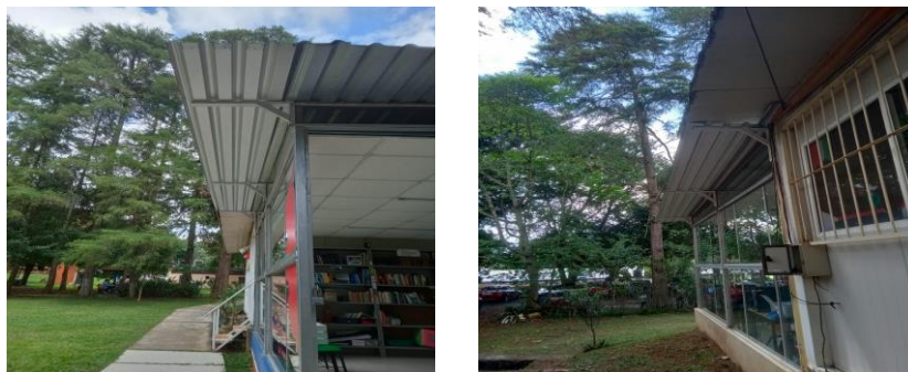
Mantenimiento del techo. Sala del Programa de lectura.