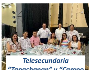
Telesecundaria "Tapachapan" y "Campo"