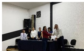
Telesecundaria "Lázaro Cárdenas"