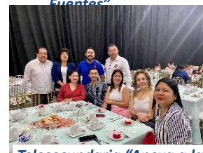
Telesecundaria "Anexa a la Normal Veracruzana"