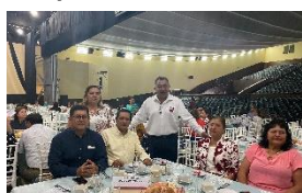
Telesecundaria "18 de Marzo"