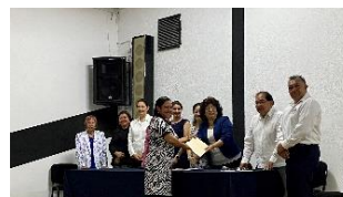
Telesecundaria "Jaime Torres Bodet"