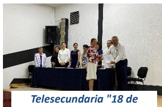
Telesecundaria "18 de Marzo"