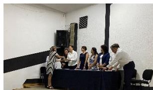
Telesecundaria "Campo Viejo"