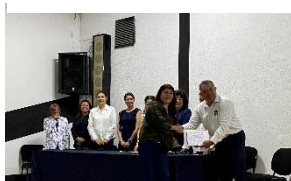
Telesecundaria "Revolución Mexicana"