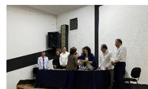
Telesecundaria "Benito Fentanes"