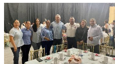
Telesecundaria "Álvaro Gálvez y Fuentes"