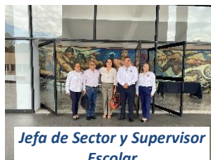
Jefa de Sector y Supervisor Escolar