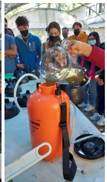
Mezcla preparada colocada en aspersor