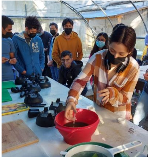
Incorporación de caldo sulfocálcico como fungicida para plantas