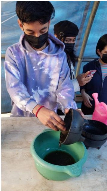
Molido de plantas en molcajete