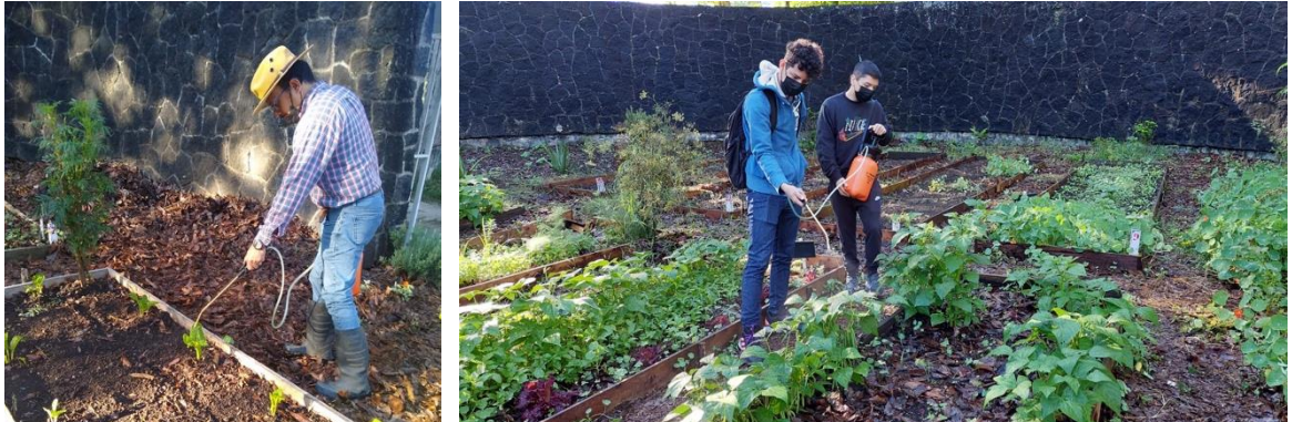
Aplicación del extracto directamente a los cultivos para el control de plagas