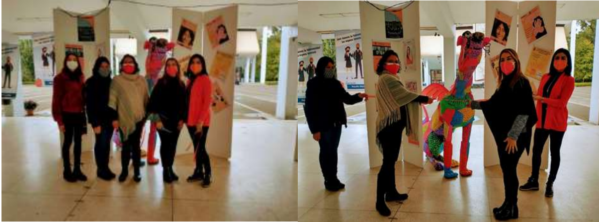
Gracias comunidad normalista por la solidaridad y sororidad.