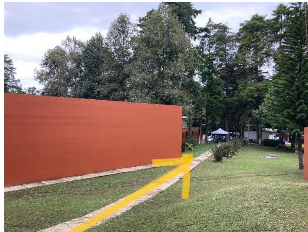
Rumbo al estacionamiento trasero de la BENV